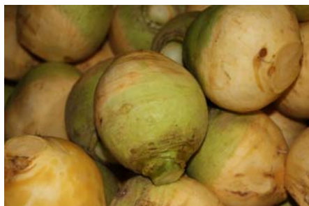
Haverlanda gård, Linköping. Kålrot 25 ha. Växtföljd 8 år – samverkan med grannar – förfruktsvärde. "Försörjer" ICA Sverige med kålrot.