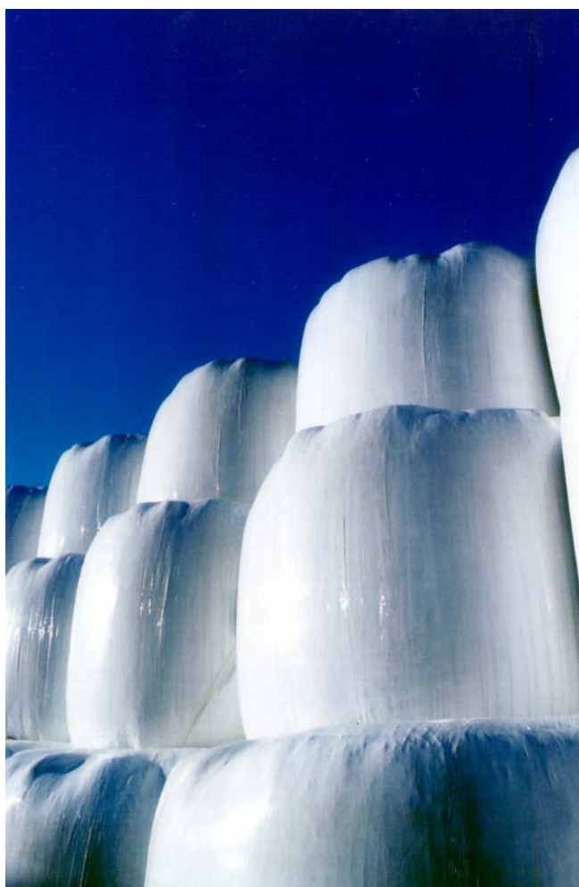
Vallfoder, en viktig resurs i utfodringen.