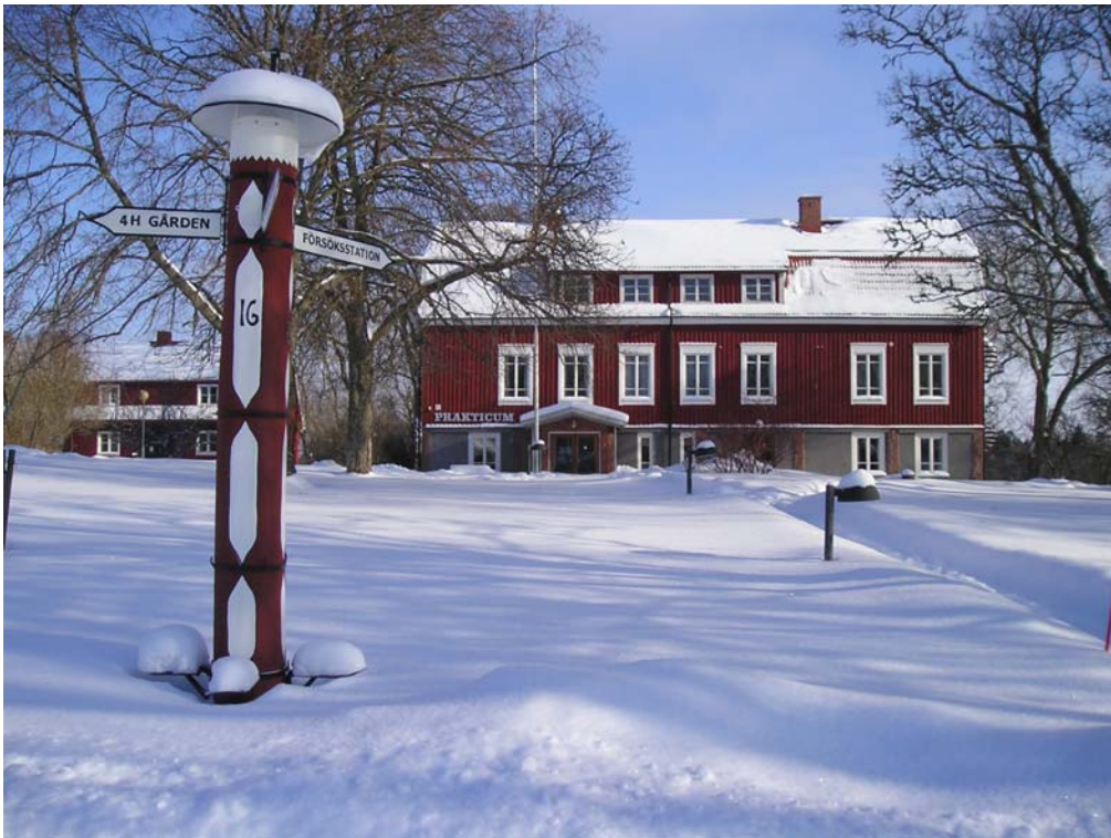
Practicum, Ålands Landsbygdscentrum